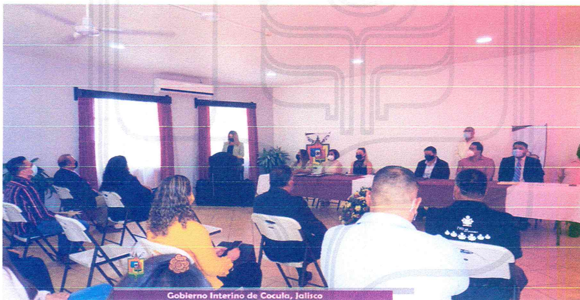
Gobierno Interino de Cocula, Jalisco

El maestro es un mediador entre el alumno y el ambiente que le rodea para que mediante su inserción en los espacios educativos trasciendan como agentes de cambio en el espacio donde se desenvuelven. “reconocer su labor es un privilegio.”