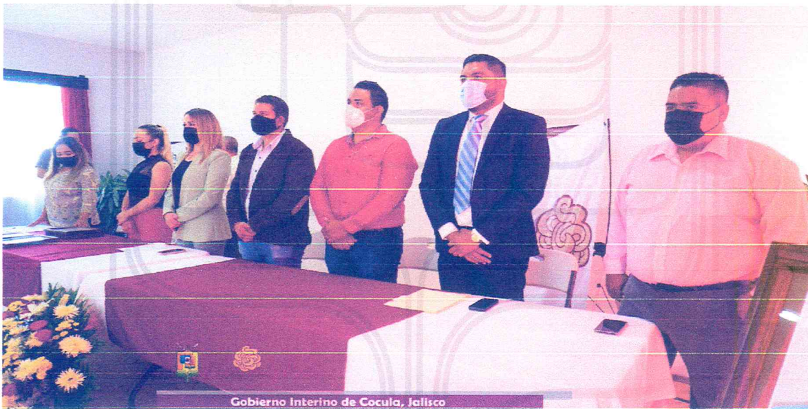
Gobierno Interino de Cocula, Jalisco