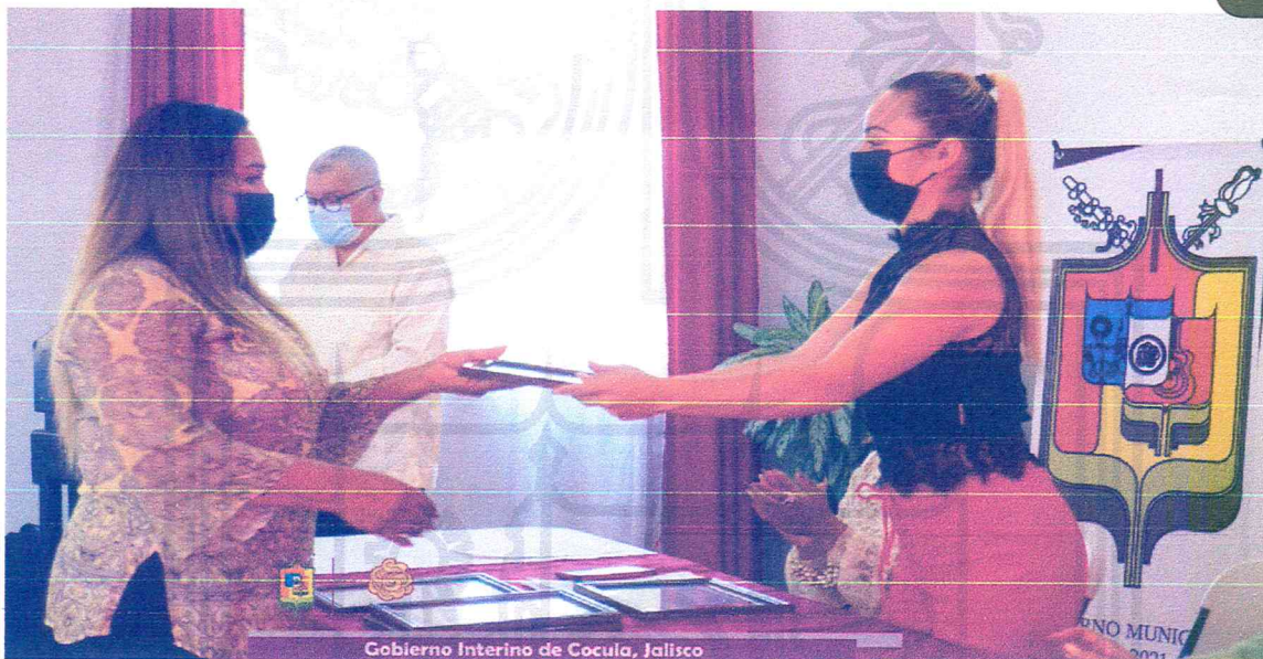
Gobierno Interino de Cocula, Jalisco