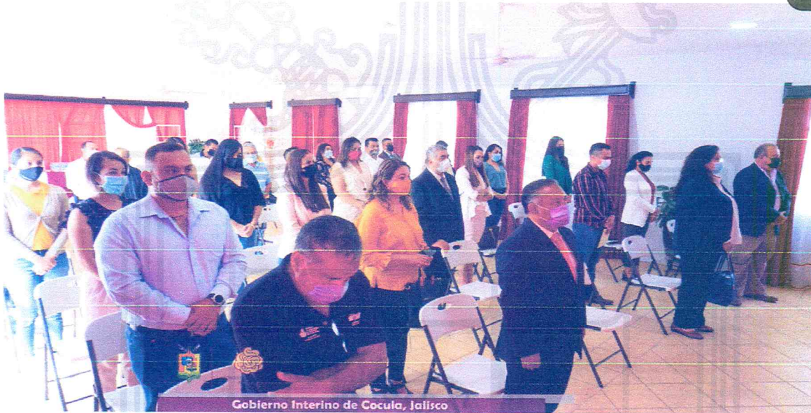
Gobierno Interino de Cocula, Jalisco